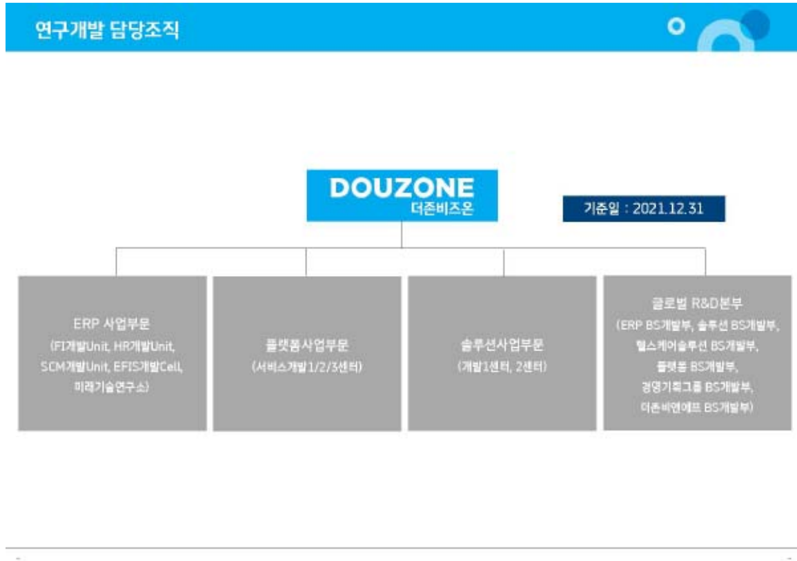
20211231_더존비즈온 연구개발 담당조직